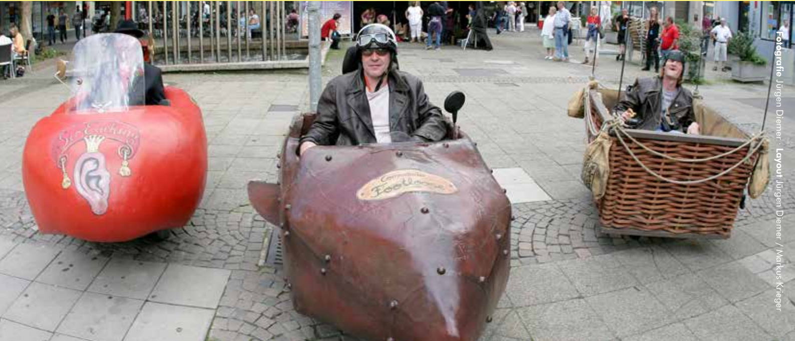
Layout Jürgen Diemer / Markus Krieger